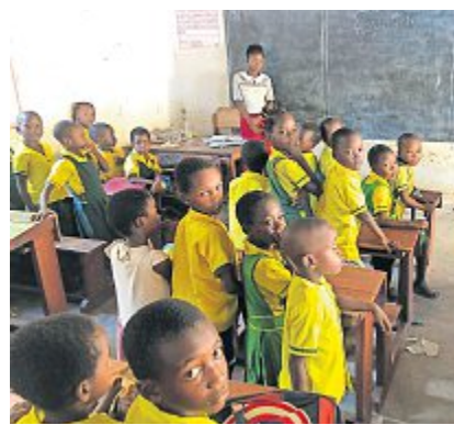
Dank der Verpflegung werden sie künftig konzentrierter lernen können.