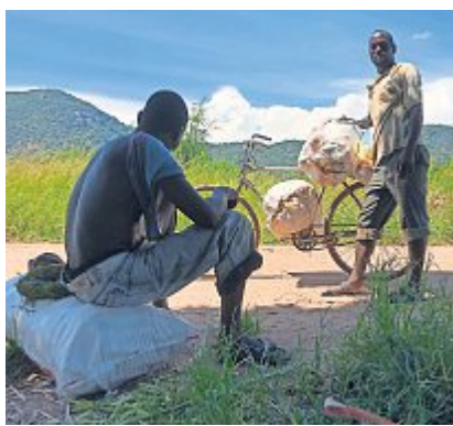
Vieles ist Handarbeit. So auch der lokale Maistransport.

Die Infrastruktur der Schule, welche direkt am südlichen Ende des Malawisee steht, wurde in den vergangenen Jahren ständig optimiert. Neben zusätzlichen Klassenzimmern und der Anschaffung von Schulbänken wurde im Frühling