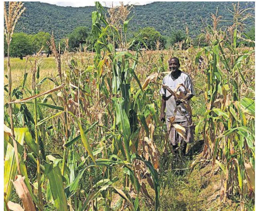
Die Bewirtschaftung und die Ernte erfolgt manuell.